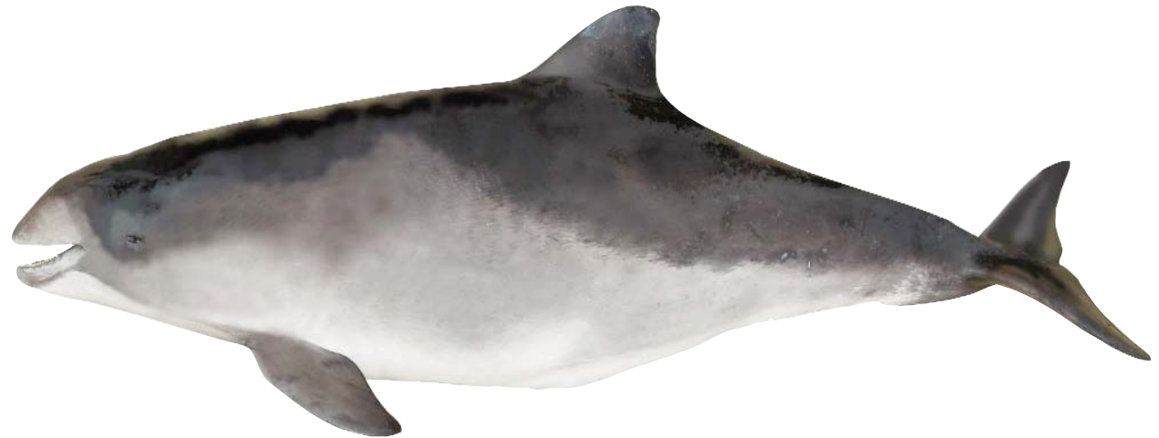
Ilustrazioa: © Tokio

XX garren menderarte ehizatuak izan ziren europako zenbait herrialdetan, Danimarka eta Norbeian adibidez, Erdi-aroan espainiako portuetan saltzen eta kontsumitzen zituztelaren susmoa dago, orduko erligioaren arabera, baraugaraian haragia debekatua zegoela eta, mazopa arraina zelakoan jaten zen.